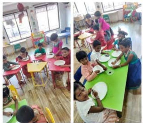
PIC • COLLAGE